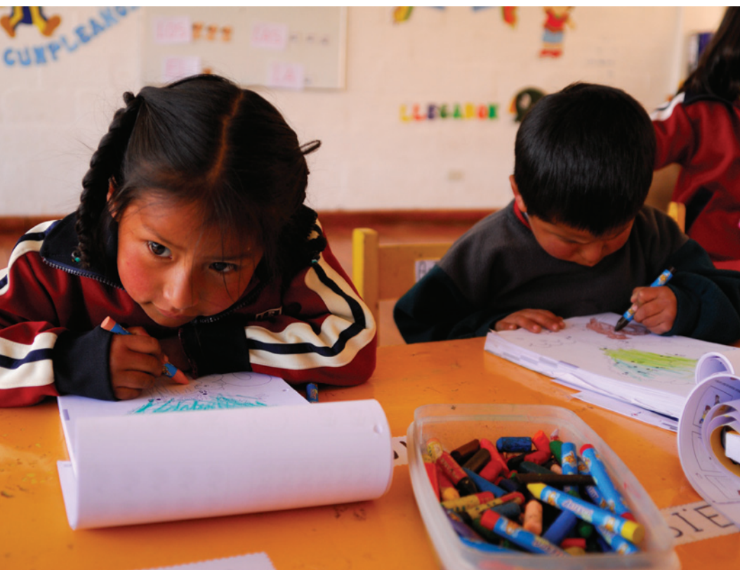
Raúl Egúsqiza/ Niños del Milenio

Continuando con la tendencia de la región, el Estado peruano también asumió durante la última década, una serie de compromisos para incrementar los servicios de nutrición, salud y educación para la primera infancia y mejorar su calidad de atención. Entre tales responsabilidades figuran el Acuerdo Nacional, el Plan de Acción por la Infancia y la Adolescencia, el Proyecto Nacional de Educación, y recientemente el Pacto Social por la Primera Infancia. A pesar de ello, el acceso a servicios de AEPI de buena calidad continúa siendo limitado, sobre todo entre las poblaciones más vulnerables, incluyendo niñas y niños de hogares pobres, que habitan en zonas marginales y rurales, que presentan un estado nutricional deficiente o que tienen alguna discapacidad.