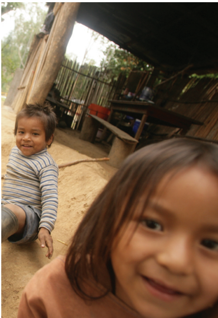
Sebastián Castañeda / Niños del Milenio

Como se observa en el Cuadro 1 , la asistencia a centros de educación inicial está asociada a niveles de pobreza. El 29% de niños y niñas de seis años provenientes de los hogares “más pobres” de la muestra no ha asistido a un centro de educación inicial, en comparación con apenas el 4% de los niños de hogares “menos pobres” 3 . En términos generales la diferencia de género no es estadísticamente significativa, aunque sí lo es en las zonas rurales —el 80% de los varones fueron a un centro inicial, en comparación con el 75% de las niñas (Woodhead y otros, 2009). Dicha diferencia fue también corroborada en nuestros estudios cualitativos, donde el grupo de infantes que no acudía a un centro de educación inicial estaba conformado íntegramente por niñas (Ames y otros, 2009).